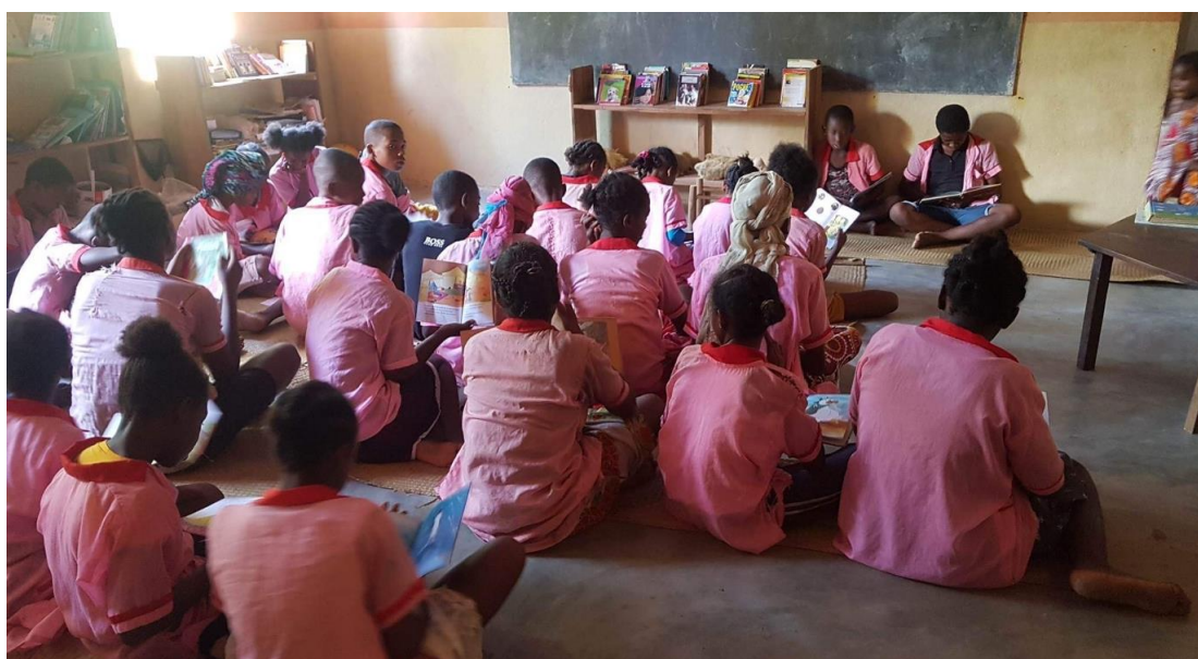
Una sessione di lettura nella scuola Mamiko di Djangoa

Dalla sua fondazione nel 2018, Boky Mamiko ha sostenuto la scuola Mamiko di Djangoa , un villaggio costiero rurale a circa 20 km da Ambanja, la capitale del distretto. La scuola è stata fondata nel 2008 dalla signora Geneviève Soaritony e originariamente comprendeva un asilo nido e una scuola elementare. Con il sostegno finanziario di Boky Mamiko, nel 2018 è stata aperta una biblioteca scolastica e nel 2019 una scuola secondaria . Nel 2018 abbiamo anche fornito alla scuola Mamiko pannelli solari , un computer, una stampante e un proiettore. Nell'anno scolastico 2023-2024 sono stati iscritti alla scuola Mamiko 275 studenti, di cui 72 nella scuola secondaria. Oltre ai libri e ai materiali didattici, il nostro sostegno alla scuola Mamiko comprende gli stipendi degli insegnanti e del bibliotecario, le attività di educazione ambientale e la formazione degli insegnanti. Inoltre, dieci degli studenti che hanno ricevuto le borse di studio Boky Mamiko nel 2023 sono originari dello stesso villaggio di Djangoa.