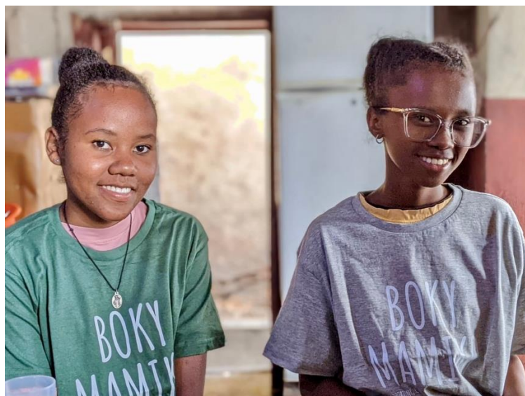
...e alla Université Catholique de Madagascar (UCM) ad Antananarivo