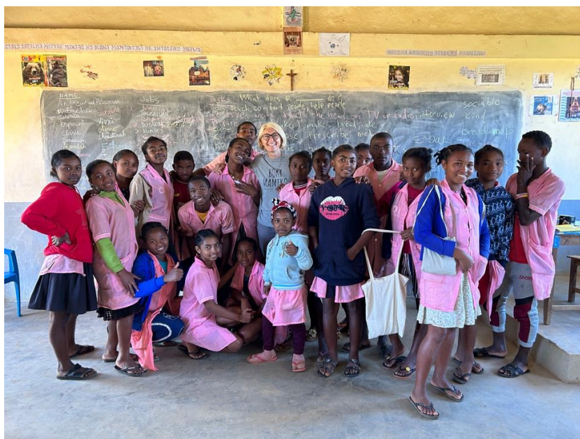
Studenti alla scuola Saint Laurent in Beandrezona

Nel 2021 abbiamo iniziato a collaborare anche con la scuola Saint Laurent di Beandrezona , un villaggio rurale vicino a Bealanana, una città in una regione senza sbocco sul mare a sud di Ambanja. Circa 400 studenti , dalla scuola materna alla scuola secondaria, frequentano St. Laurent. Boky Mamiko fornisce a questa scuola libri di testo e libri per la biblioteca scolastica, oltre a un sostegno finanziario per pagare gli stipendi degli insegnanti e per gestire la mensa scolastica, frequentata da 90 studenti al giorno nel 2023. Nel 2022 abbiamo finanziato anche la costruzione della mensa scolastica, dell'orto e dei servizi igienici. Inoltre, nove degli studenti che hanno ricevuto le borse di studio Boky Mamiko nel 2023 sono originari del villaggio di Beandrezona.