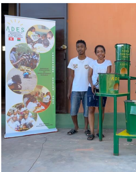
La visita a ADES in Antsohihy (Maggio 2023)