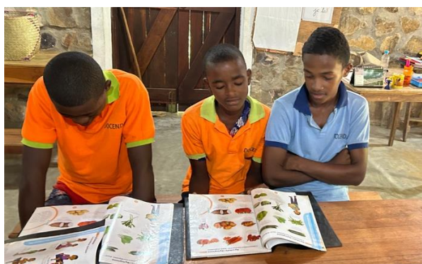
Studenti durante una sessione di lettura presso la scuola Docenda di Anjanjano

Nel 2019 abbiamo iniziato una collaborazione con Docenda , una scuola situata nel remoto villaggio di Anjanjano , raggiungibile solo in barca (o meglio piroga) da Ankify, il porto che collega l'isola principale all'isola di Nosy Be. La scuola è stata fondata nel 2012 dalla signora Irène Petit, presidente dell'ONG francese Docenda , e offre istruzione gratuita a 177 bambini di età compresa tra i 3 e i 18 anni. Circa la metà di questi bambini cammina ogni giorno per più di un'ora attraverso la foresta per andare a scuola. L'altra metà proviene da villaggi ancora più lontani (diverse ore di piroga) e quindi rimane ad Anjanjano durante l'anno scolastico. La nostra collaborazione con Docenda include la fornitura di libri e materiali didattici , il sostegno finanziario per la costruzione della biblioteca scolastica nel 2022, nonché la co-gestione del nostro programma di borse di studio per le scuole superiori . Infatti, undici degli studenti che hanno ricevuto borse di studio Boky Mamiko nel 2023 hanno completato la loro istruzione secondaria inferiore a Docenda.