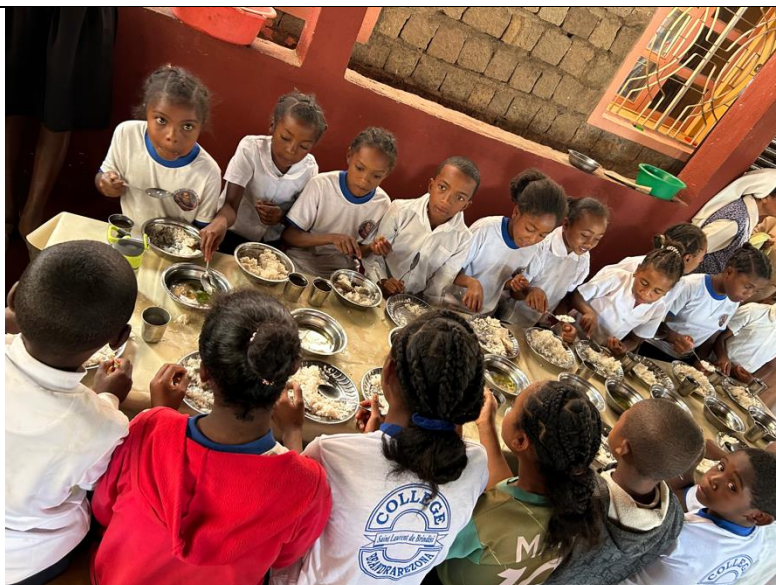
I pasti scolastici fungono da incentivo per andare a scuola e aiutano a migliorare la capacità di apprendimento dei bambini