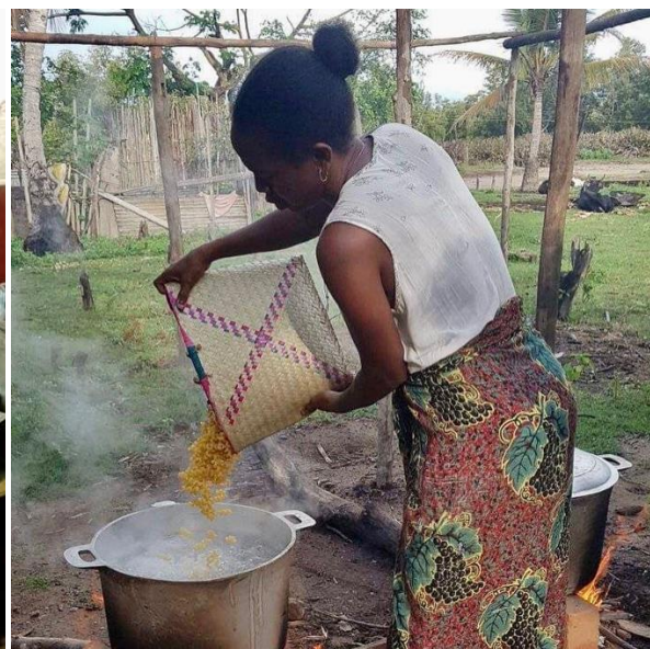
Le cuoche delle mense scolastiche St.Laurent e Mamiko