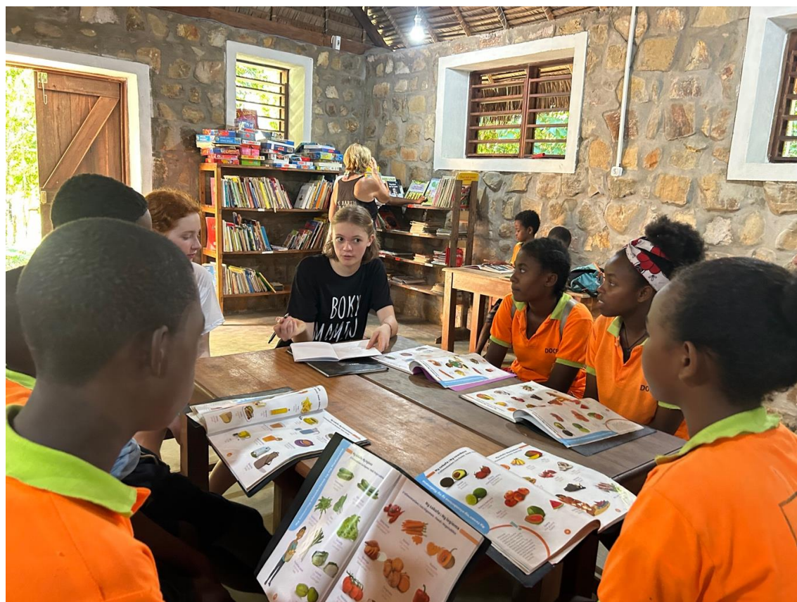
Gli studenti di Docenda discutono delle loro abitudini alimentari con i volontari di Boky Mamiko

Lo studio conclude che per ripristinare livelli sani di vitamine e minerali nel sangue, la soluzione sostenibile sarebbe una dieta bilanciata. Questo obiettivo potrebbe essere raggiunto attraverso l'educazione alimentare. Tuttavia, i notevoli limiti finanziari e infrastrutturali delle aree rurali del Madagascar, insieme a un forte legame culturale con il riso, suggeriscono che nel breve periodo una soluzione più efficace potrebbe essere quella di integrare la dieta degli studenti con integratori di vitamina B e complessi di ferro, calcio e magnesio.