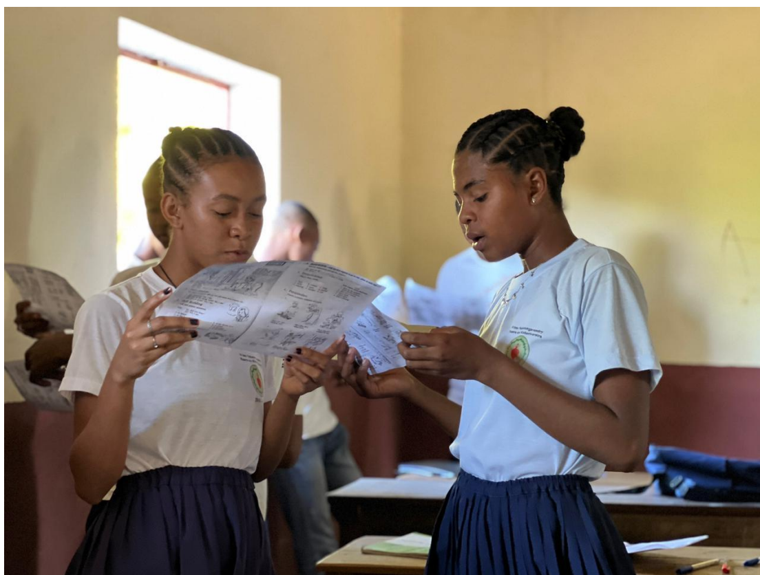
Studenti al Corso di conversazione Inglese a Casa Pasquale a settembre 2023