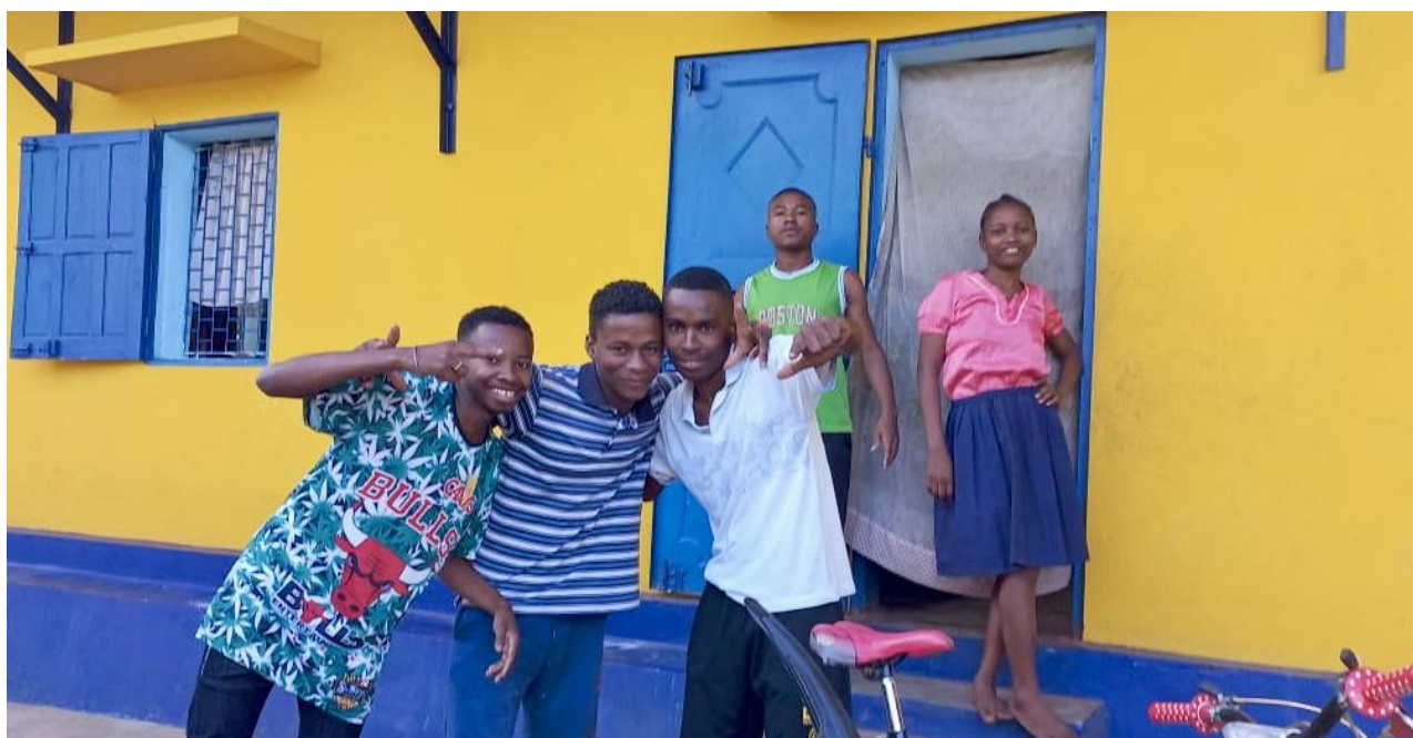
I nostri borsisti il giorno prima del loro esame finale alla scuola superiore: Il loro buon umore è stato una premonizione per il loro successo! (luglio2023)