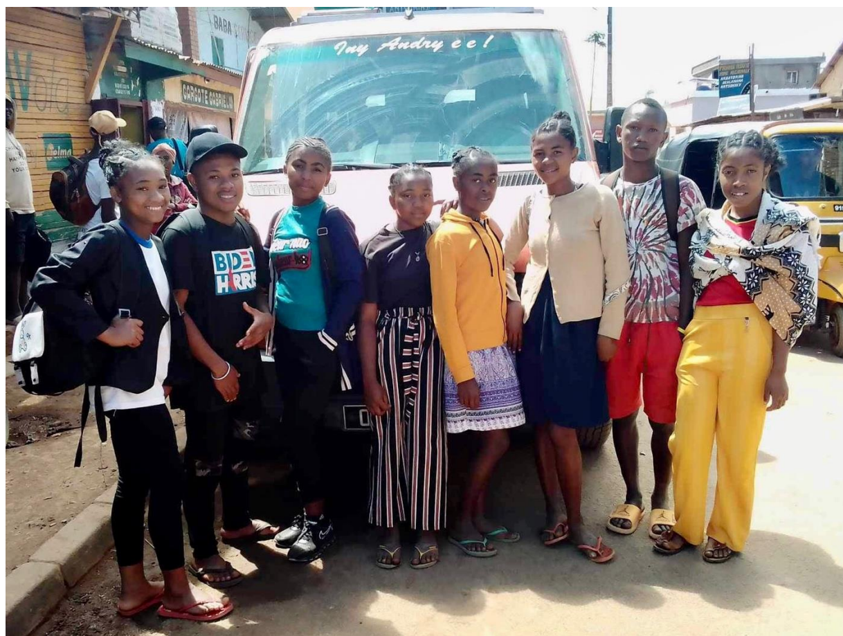
I nostri borsisti da Beandrarezona pronti per iniziare il nuovo anno scolastico a Casa Pasquale – St Joseph school a Maherivaratra (Settembre 2023)