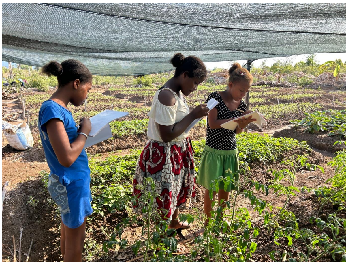
Apprendimento esperienziale: condurre una ricerca nell'orto di Casa Pasquale

L'ultima sera, ogni gruppo ha mostrato a tutta la comunità ciò che aveva imparato e creato. Un acceso dibattito, manifesti colorati che rappresentavano il tipo e la quantità di piante diverse nel giardino di Casa Pasquale, e il primo numero di un giornale scolastico sono stati i risultati sorprendenti di questi laboratori. L'entusiasmo degli studenti è stato incoraggiante e ha confermato che l'apprendimento esperienziale è la chiave per un'educazione olistica e duratura.