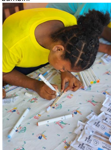
Le bambine di Casa Pasquale hanno scritto con orgoglio i loro nomi sui loro nuovi spazzolini da denti in bambù (ottobre 2023)