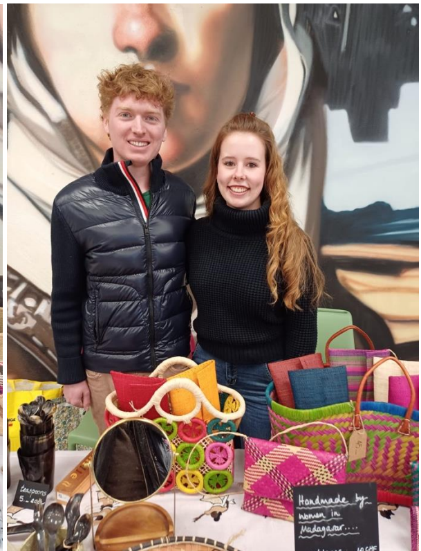
Istantanee alla nostra vendita di beneficenza al Parco Grancia (Lugano)