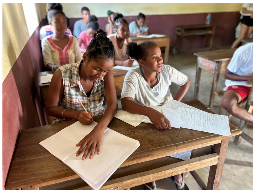
Studenti del liceo Saint Joseph di Maherivaratra

Nel 2021 abbiamo iniziato una collaborazione con la scuola Saint Joseph di Maherivaratra , che si trova a circa 20 chilometri a nord di Ambanja. Questa scuola ha 420 studenti , dalla scuola materna alla scuola superiore. La scuola è collegata a Casa Pasquale , una casa di accoglienza per studenti che ospita 93 studenti, di cui 27 ricevono una borsa di studio Boky Mamiko in pensione completa . Oltre al programma di borse di studio, Boky Mamiko sostiene la scuola St. Joseph e Casa Pasquale finanziando libri, stipendi e formazione degli insegnanti, salute e nutrizione, infrastrutture e manutenzione. Abbiamo anche creato una biblioteca per Casa Pasquale e finanziato la realizzazione di un grande orto.