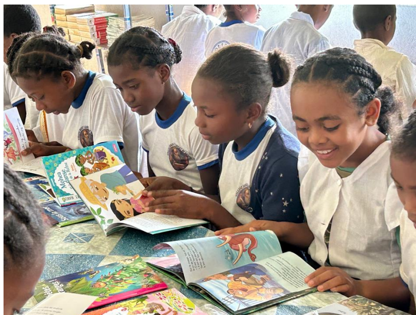
Studenti alla Saint Laurent school a Beandrazona si divertono leggendo libri alla biblioteca (Maggio 2023)