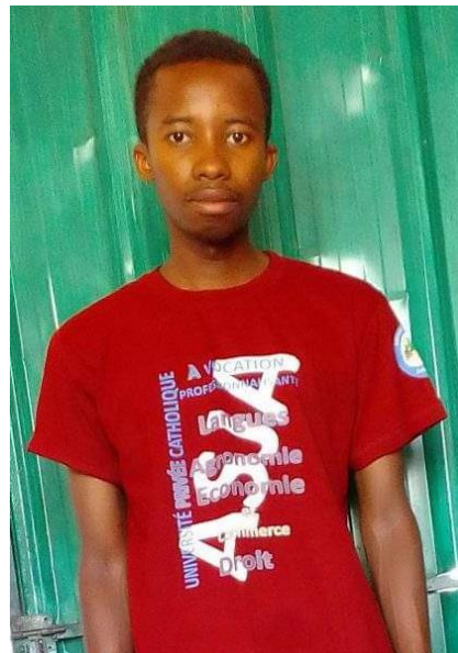
I nostri borsisti presso Athénée St Joseph in Antsohihy (ASJA)...