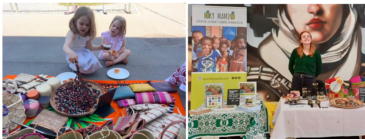
I nostri mercatini estivi e natalizi a Zurigo e Lugano, Svizzera