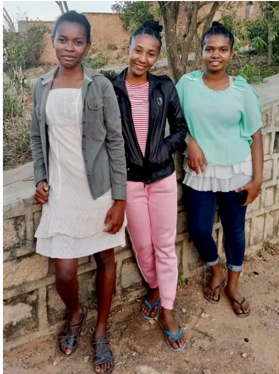
Le nostre borsiste che frequentano il programma di formazione per insegnanti Presso Institut Supérieur Pédagogique d'Antananarivo (I.S.P.A.)...