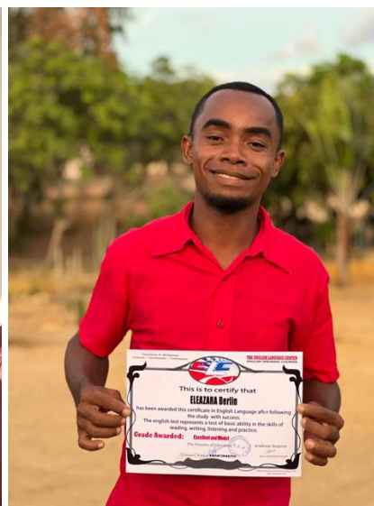
Insegnanti che praticano la conversazione in lingua inglese e mostrano con orgoglio il loro certificato di frequenza