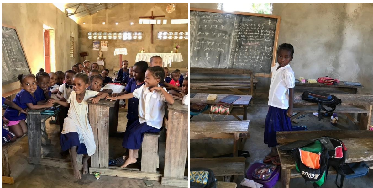
Studenti della scuola St.Giovanni XXIII a Beramanja

Siamo anche in contatto regolare con i direttori di diverse altre scuole e università frequentate da studenti borsisti di Boky Mamiko, tra cui la scuola superiore SE. VE. MA. ad Ambanja, l' Institut Supérieur Pédagogique d'Antananarivo (ISPA), l'Institut Supérieur Paramédicaux Sambirano (ISPS), l'Athénée St Joseph di Antsohihy (ASJA), l'Université Catholique de Madagascar di Antananarivo, l'Ecole Supérieure Polytechnique d'Antsiranana di Diego Suarez e la scuola alberghiera professionale Wings of Change di Nosy Be. I direttori di questi istituti ci tengono informati sui risultati accademici e sullo stato di salute dei nostri borsisti.