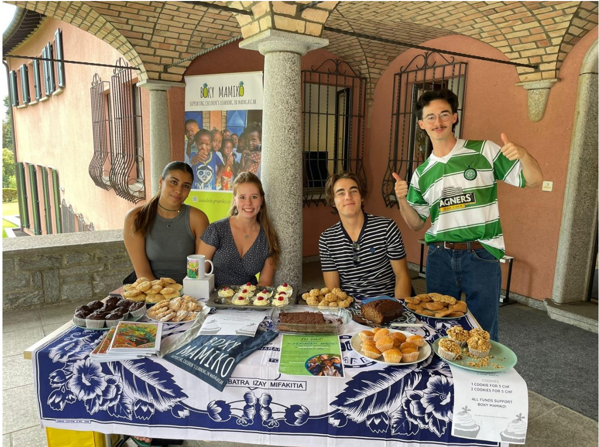
Una vendita di beneficenza di dolci organizzati dagli studenti della Franklin University Svizzera