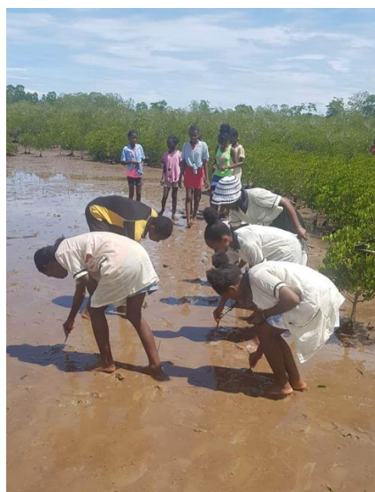
Piantagione di mangrovie alla scuola Mamiko Giornata della riforestazione delle mangrovie